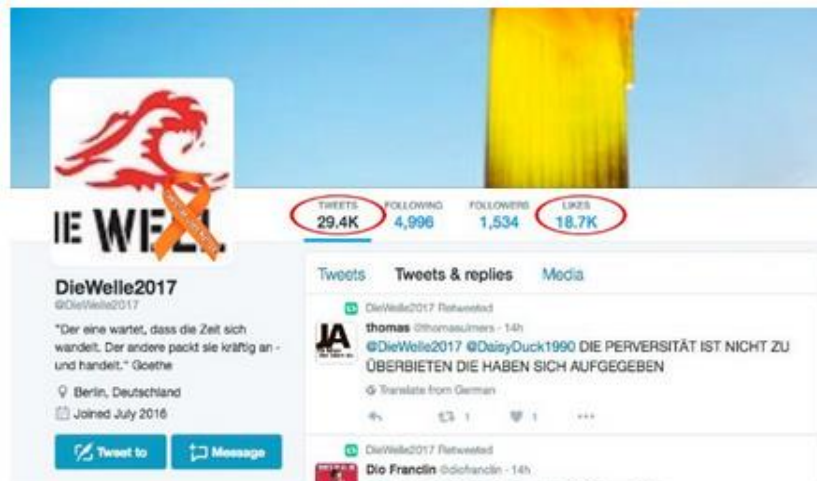
Twitter account @ diewelle2017