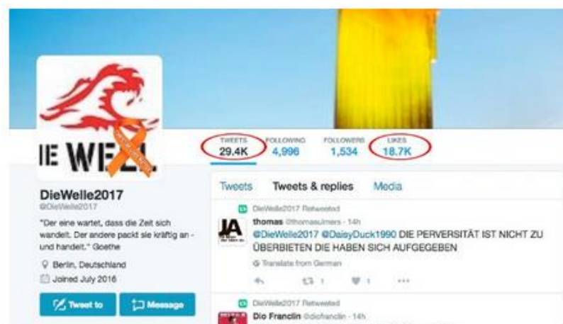
Twitter account @ diewelle2017

Ας δούμε το πιο κάτω παράδειγμα. Ο λογαριασμός “DieWelle2017” δημιουργήθηκε τον Ιούλιο του 2016, αλλά έφτασε ήδη τις 30,000 αναρτήσεις.